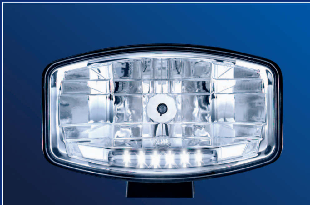
Jumbo 320 Xenon с светодиодным габаритным светом