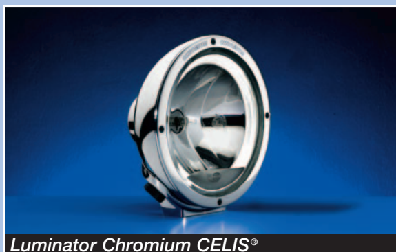
Luminator Chromium CELIS®

Наряду с габаритным светом CELIS®, светодиоды питают оптические элементы, имеющие типовую дискообразную форму источника света.