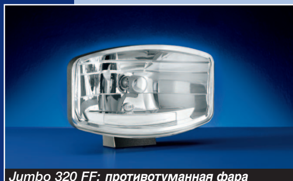
Jumbo 320 FF: противотуманная фара

Сохраняя дизайн обтекаемых форм у современных грузовиков, модели Jumbo сейчас придан современный безошибочный внешний вид – чёткая прямоугольная форма уступила место более округлым сверху и внизу очертаниям. Корпус исключительной прочности предохраняет последние технологические достижения: Не менее шести светодиодов образуют полосу сигнальных огней, существенно отличающихся от световых сигналов, которые мы видим на дорогах мира. А потому модель Jumbo на дороге узнаётся ещё издали!