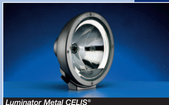
Luminator Metal CELIS®

Luminator Metal CELIS® Luminator Chromium CELIS®