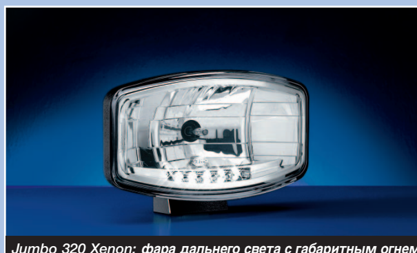
Jumbo 320 Xenon: фара дальнего света с габаритным огнем