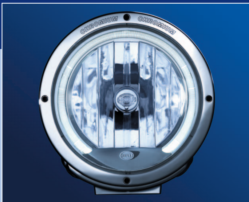
Габаритный свет Luminator Chromium CELIS®

Новизну модели Luminator CELIS® придаёт не только ослепительно яркий функциональный свет, но и также габаритный огонь, выполненный в современном стиле. Оптический элемент в форме ободка со светодиодным источником придаёт фаре – и всему автомобилю неподражаемый внешний вид.