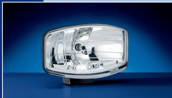
Jumbo 320 FF: фара дальнего света с габаритным огнем

Сохраняя дизайн обтекаемых форм у современных грузовиков, модели Jumbo сейчас придан современный безошибочный внешний вид – чёткая прямоугольная форма уступила место более округлым сверху и внизу очертаниям. Корпус исключительной прочности предохраняет последние технологические достижения: Не менее шести светодиодов образуют полосу сигнальных огней, существенно отличающихся от световых сигналов, которые мы видим на дорогах мира. А потому модель Jumbo на дороге узнаётся ещё издали!